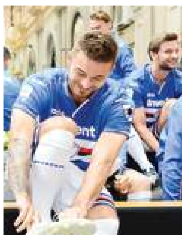
Linetty si prepara